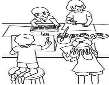
Feliz Día del Maestro!