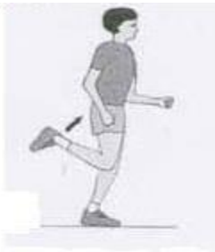
Talones al glúteo

Desplazamiento con talones a los glúteos.