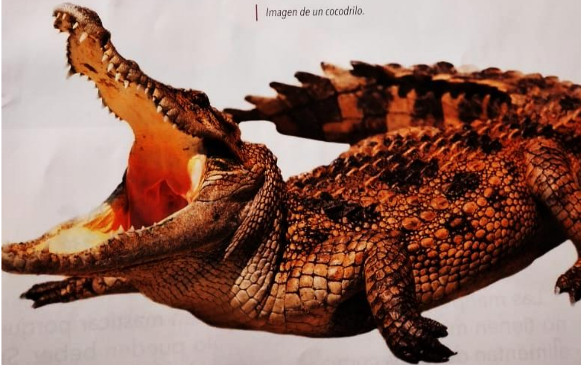
| Imagen de un cocodrilo.

El cocodrilo entonces limpia y cuida sus dientes de una forma muy especial. Recurre a un pájaro llamado chorlito egipcio. Este pájaro se mete en la boca del cocodrilo y saca los restos de carne que quedan entre sus dientes. Como el cocodrilo aprecia mucho este servicio, jamás intenta comerse al chorlito.