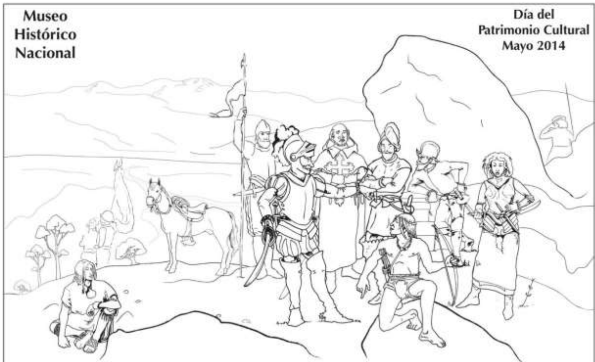
Pedro Lira Rencoret. 1966. La Fundación de Santiago / Ilustrador: Alex Olave Hevia