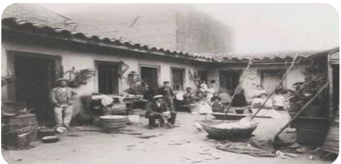
ILUSTRACIÓN: Que consiste en un dibujo, que ilustra o representa algún acontecimiento o fenómeno de la realidad. Muchas veces acompañan o adornan un libro. Constituye una recreación de una época determinada.

CARICATURA: Es la representación deformada de la realidad, de un personaje o de una situación.