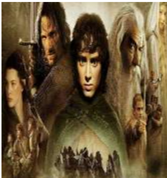
EL SR. DE LOS ANILLO