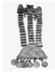
⬆ Adornos y joyas