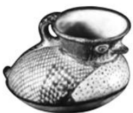
⬆ Vasija de cerámica diaguita

8.- Según el texto, encierra en un círculo los elementos que pertenecen al pueblo mapuche . Puedes apoyarte con las imágenes que aparecen en los recursos de las páginas 68 a 76 de tu libro escolar.