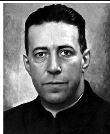
San Alberto Hurtado

Sacerdote Jesuita, el sello de este ejemplar hombre fue la solidaridad y la entrega a los demás. Quiso imitar a Jesús en las cosas sencillas de cada día. Este santo chileno se puso al servicio de los más pobres fundando un lugar para ellos, su gran obra "El hogar de Cristo". Murió el 18 de agosto de 1952, por eso agosto es recordado como el mes de la solidaridad.