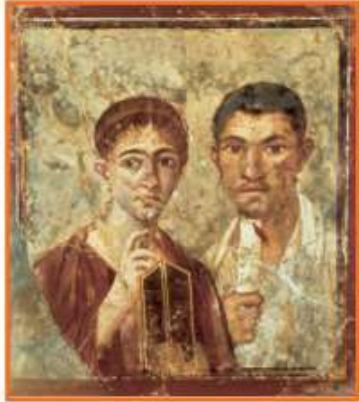
↳ Pintura romana, retrato de dos esposos.

El arte ha sido parte fundamental de la vida del ser humano a lo largo de su historia. Esta forma de expresión se relaciona con la época en que se desarrolla y nos permite conocer parte del pasado. Griegos y romanos nos dejaron una gran diversidad de obras como pinturas, esculturas, mosaicos, cerámicas y edificios. Los ideales de belleza y perfección del cuerpo humano del arte griego han influenciado a artistas de muchas épocas y muchas partes del mundo, incluso de Chile.