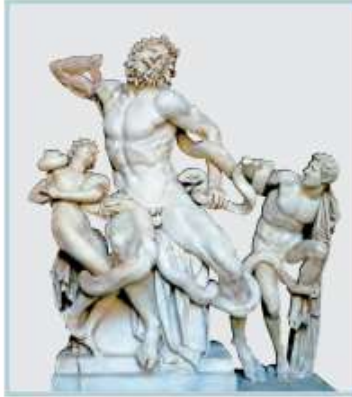
↳ Laocoonte y sus hijos, escultura griega.