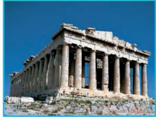
↳ Partenón, en la ciudad de Atenas, Grecia.