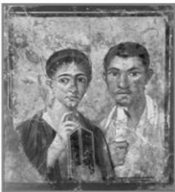
κ Pintura romana, retrato de dos esposos.

El arte ha sido parte fundamental de la vida del ser humano a lo largo de su historia. Esta forma de expresión se relaciona con la época en que se desarrolla y nos permite conocer parte del pasado. Griegos y romanos nos dejaron una gran diversidad de obras como pinturas, esculturas, mosaicos, cerámicas y edificios. Los ideales de belleza y perfección del cuerpo humano del arte griego han influenciado a artistas de muchas épocas y muchas partes del mundo, incluso de Chile.