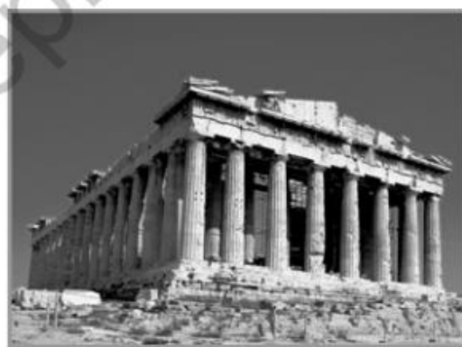
κ Partenón, en la ciudad de Atenas, Grecia.