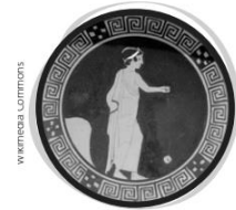
κ Niño griego jugando con un yoyo de terracota o arcilla cocida.

Las niñas y los niños griegos se entretenían con juguetes, como caballos con ruedas, pelotas, muñecas y trompos. Además, tenían mascotas, como perros, ratones o tortugas. Las niñas y los niños romanos tenían muñecas y juguetes de terracota. Entre los juegos conocidos estaban la gallinita ciega, los dados y las bolitas, entre otros.