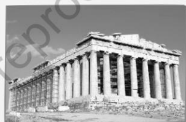
κ El Partenón de Atenas (Atenas, Grecia).