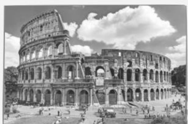
κ El coliseo romano (Roma, Italia).

Griegos y romanos crearon obras de ingeniería y arquitectura que les permitieron transformar su entorno y desarrollar construcciones cuyo objetivo era solucionar las necesidades de la población, crear espacios públicos y embellecer sus ciudades.