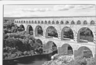
κ Acueducto romano, puente del Gard (Gard, Francia).