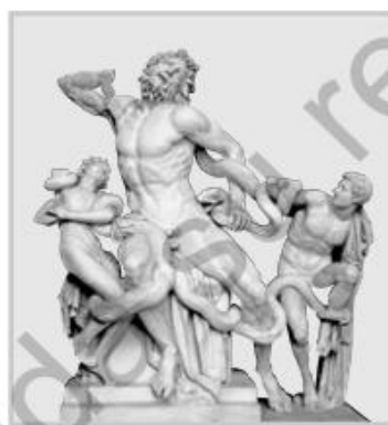
κ Laocoonte y sus hijos, escultura griega.