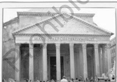
κ El Panteón romano (Roma, Italia).