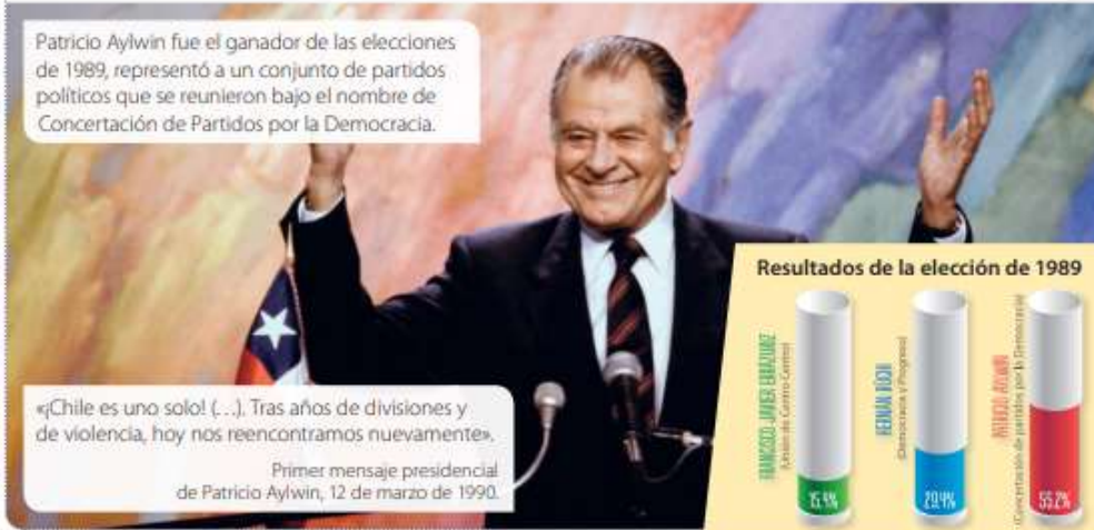
Resultados de la elección de 1989

Primer mensaje presidencial de Patricio Aylwin, 12 de marzo de 1990.