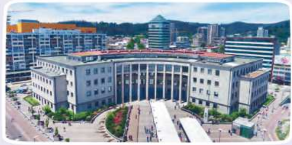
Tribunales de Justicia de Concepción.

Los miembros de la Corte Suprema, son designados por el presidente de la República con acuerdo del Senado.