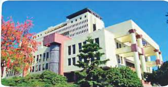
Congreso Nacional, Valparaíso.

Nombre de un senador o senadora que actualmente representa el lugar donde vivo: