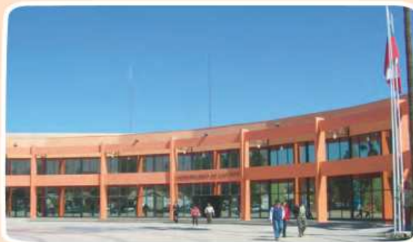
Municipalidad de Copiapó.

Estas autoridades son elegidas por los ciudadanos, permaneciendo en sus cargos, ocho años en el caso de los senadores y cuatro, en el caso de los diputados.