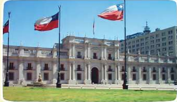
Palacio de La Moneda, Santiago.

Tiene la facultad de designar a otras autoridades como los ministros y ministras, quienes se encargan de áreas como salud, justicia, transporte y educación.