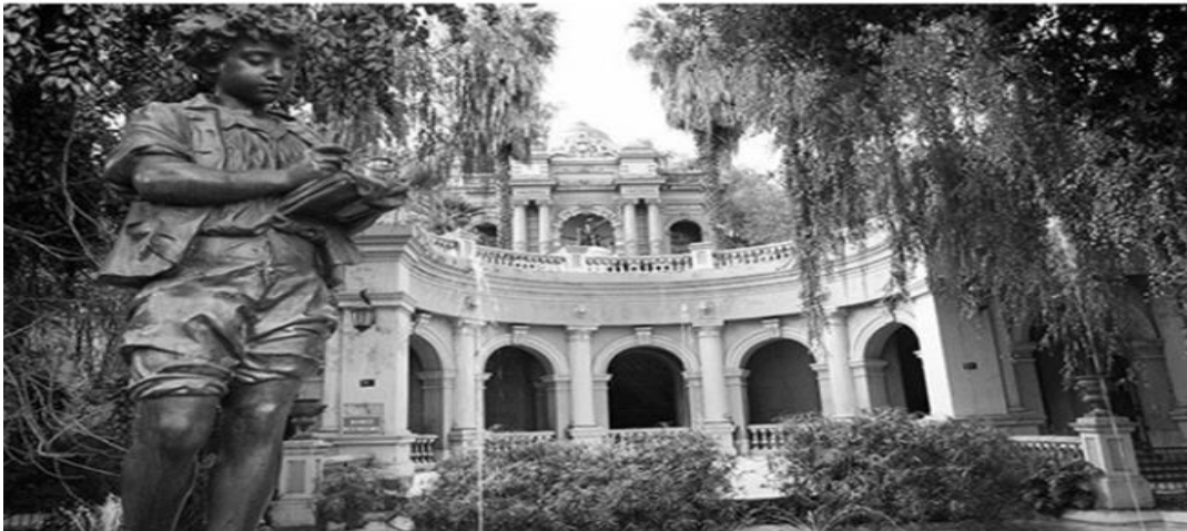
Cerro Santa Lucía

6.- Propone una acción para que todas las personas que visitan el cerro Santa Lucía lo puedan cuidar.