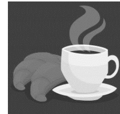
In the morning, we eat: