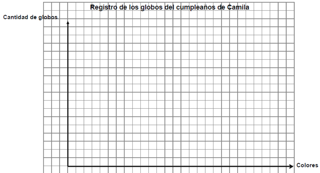
GRÁFICO DE BARRA VERTICAL