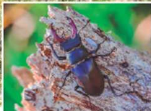
▲ Ciervo volante