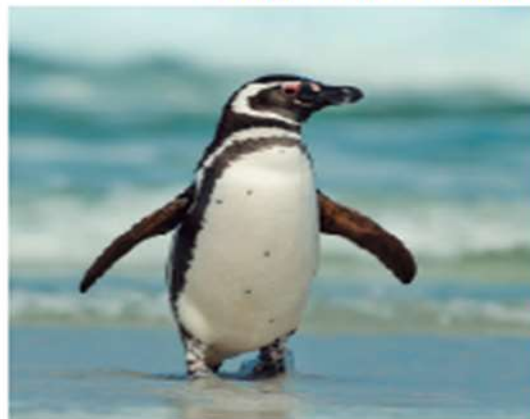
▼ Pingüino de Humboldt

Vivo en el sur y estoy en peligro de desaparecer, ya que me cazan y talan los bosques donde vivo.