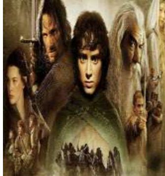
EL SR. DE LOS ANILLO