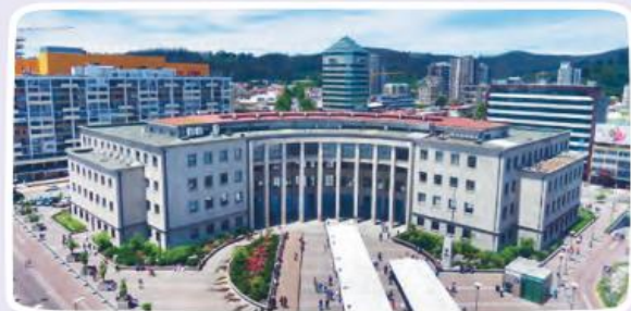
► Tribunales de Justicia de Concepción.

Los miembros de la Corte Suprema, son designados por el presidente de la República con acuerdo del Senado.