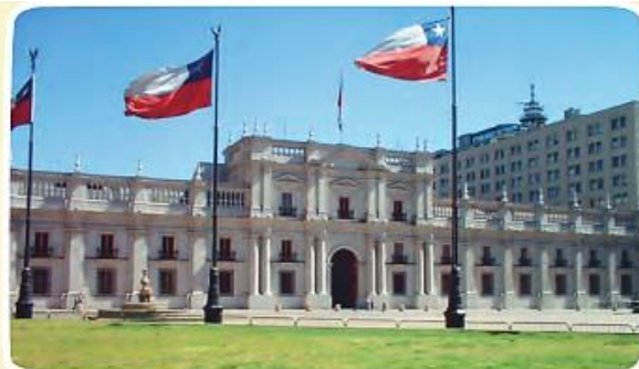
► Palacio de La Moneda, Santiago.

Tiene la facultad de designar a otras autoridades como los ministros y ministras, quienes se encargan de áreas como salud, justicia, transporte y educación.