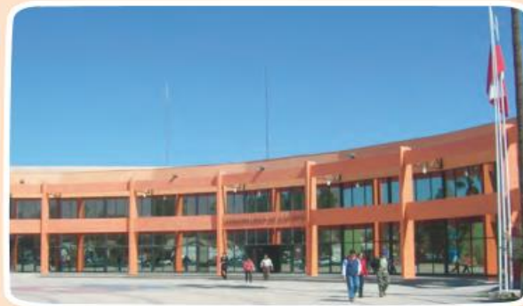
► Municipalidad de Copiapó.

Estas autoridades son elegidas por los ciudadanos, permaneciendo en sus cargos, ocho años en el caso de los senadores y cuatro, en el caso de los diputados.