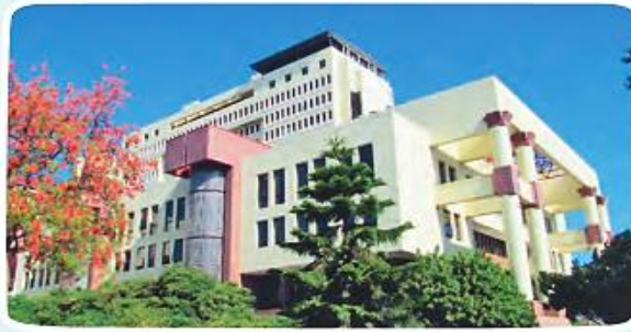
► Congreso Nacional, Valparaíso.

Nombre de un senador o senadora que actualmente representa el lugar donde vivo: